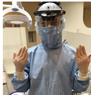
With コロナの診療スタイル

平時より治療スタッフは感染予防のためマスク着用で対応しております。現在は、新型コロナウイルス対策として受付スタッフをはじめ全スタッフがマスク、フェイスシールド、防護衣を着用しております。お手数ですが患者さまも待合室ではマスク着用のご協力をお願いします。